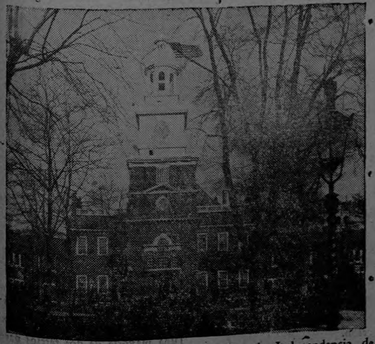
"INDEPENDENCE HALL", declaración de Independencia de los Estados Unidos fué adoptada el 4 de Julio de 1776 en Filadelfia, Pensylvania, EE. UU. Este es el sitio donde la De-